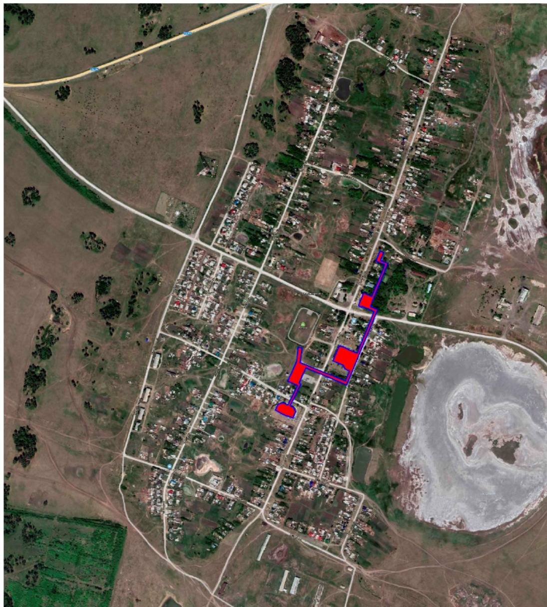
Рисунок 1.1 – Существующие зоны действия источников теплоснабжения на территории Покровского сельского поселения